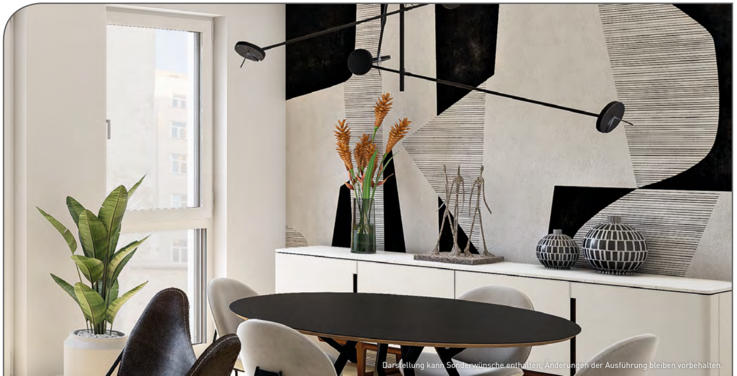
Darstellung kann Sonderwünsche enthalten, Änderungen der Ausführung bleiben vorbehalten.

Bruttoanfangsrendite – exemplarische Musterkalkulation*: